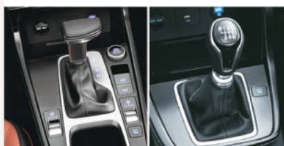
Boîte auto et manuelle à 6 rapports