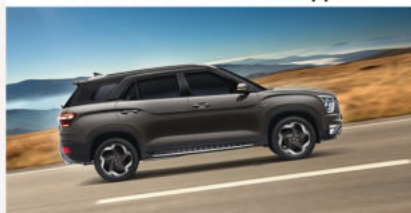
ABS+ESC+ Assistant au départ en monté (HAC)