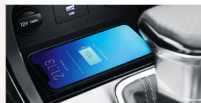
Chargeur de smartphone sans fil