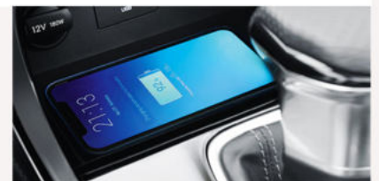
Chargement de smartphone sans fil