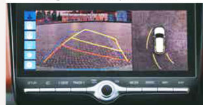
Moniteur de recul avec guidage de stationnement dynamique