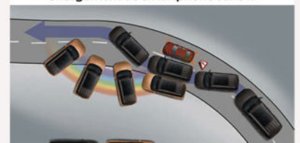
ABS + HAC + Contrôle électronique de la stabilité (ESC)