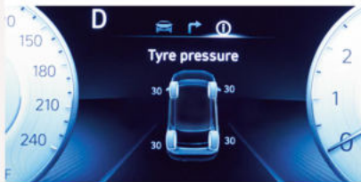
Système de surveillance de pression des pneus (OPT)